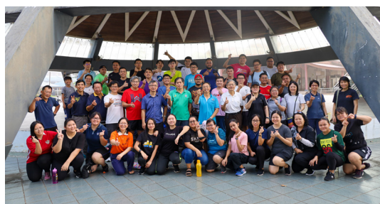
(2023年4月18日) 2023年卫理短宣学校以及卫神短宣学校正式开始为期三个月的学习。今年共有88位短宣生，分别为51位卫理短宣生、24位音乐短宣生、5位英文短宣生以及8位国语短宣生。