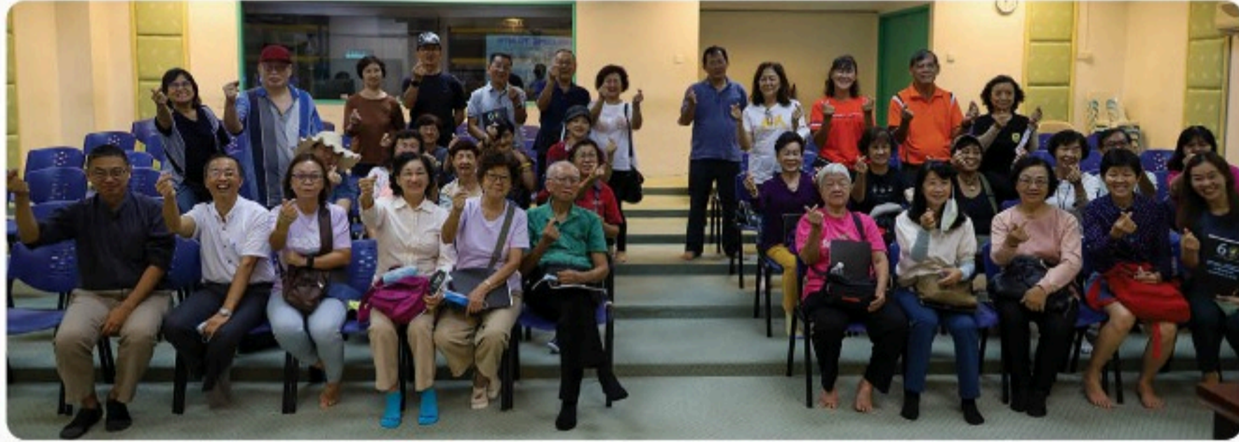
(2023年4月17日) 居銮长老会佳音堂