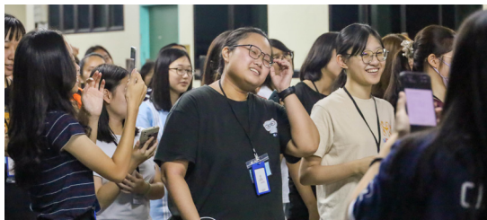
(2023年4月24日) 短宣生联谊之夜。