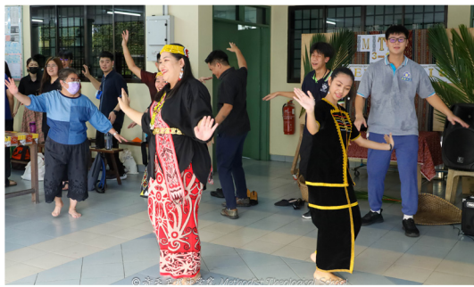
(2023年5月11日) 三合一庆典——达雅节、教师节以及上半年生日会。