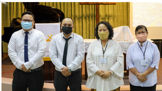
(2023年正月4日) 2023年新学期开学礼于上午九时正在卫神礼堂实体进行，并于卫神面子书同步直播。2023年卫神主题是“灵命更新”，由院长邱和平牧师主讲。今年共有9位新生和4位回校生。