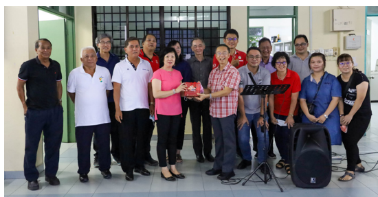
(2023年正月17日) 诗巫西教区真源堂的一群弟兄姐妹宴请卫神社体进行晚餐，共同欢庆华人农历新年。