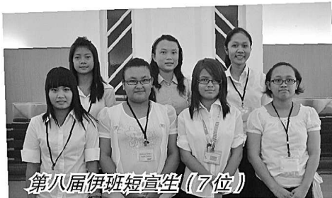
第八届伊班短宣生（7位）