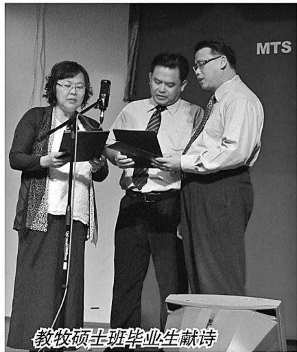
教牧硕士班毕业生献诗

9 月 29 日 怀安堂的牧者及 执事们前来和 我们共庆中秋节， 并款待本院全体 师生与员工一同 享用午餐。