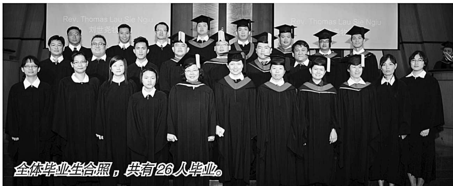
全体毕业生合照，共有 26 人毕业。