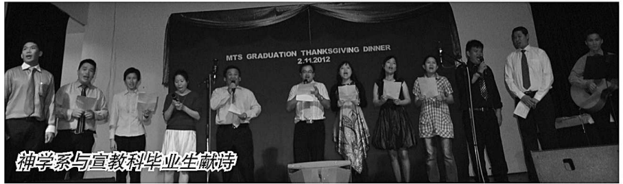
神学系与宣教科毕业生献诗