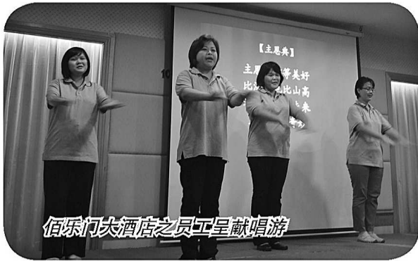
佰乐门大酒店之员工呈献唱游

本院全体师生、家人以及员工于2012年11月10日再次受邀出席并带领佰乐门大酒店的感恩礼拜。2012年正逢佰乐门大酒店创立十周年纪念，酒店的部分员工为要感谢神在过去十年来的带领，特别呈献了一首唱游《主恩典》。会后还设有午宴招待。