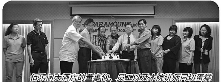
佰乐门大酒店的董事们、员工以及本院讲师同切蛋糕