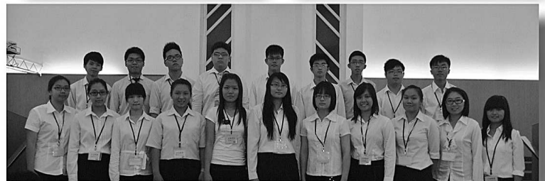
第四届音乐短宣生（20位）