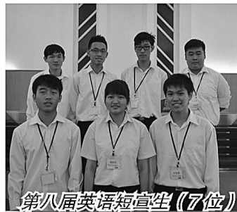
第八届英语短宣生（7位）