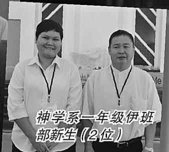
神学系一年级伊班部新生（2位）