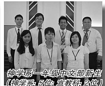
神学系一年级中文部新生（神学系5位 宣教科2位）