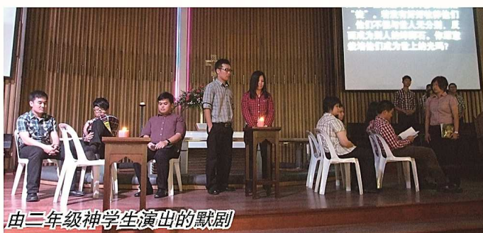
由二年级神学生演出的默剧

自的岗位上作见证，宣扬上帝的美德。但许多基督徒不知且不愿如此行，故需要更多人回应神的呼召，进入全职的服侍，成为传道人、宣教士或音乐干事，以更加专注的去传福音，及栽培信徒去宣扬上帝的美德。